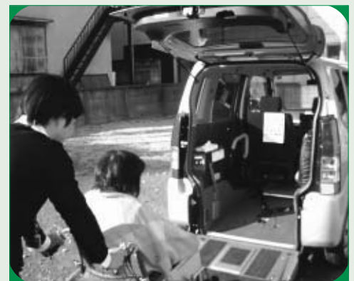
スロープ式車いす移送車 (スズキワゴンR)

車いすの方の通院やレジャー、その他社会参加のための移動手段として、介助者の負担を軽くする軽自動車を貸し出しています。 ※上記車両のほか、リフトアップシート付介護車(ダイハツムーブ)もあります。 ※ガソリン代のみ利用者負担です。