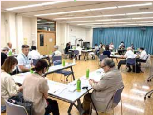
「地域の顔の見える関係づくりの場」である地域支援会議でのご意見 (なごみの家北小岩)