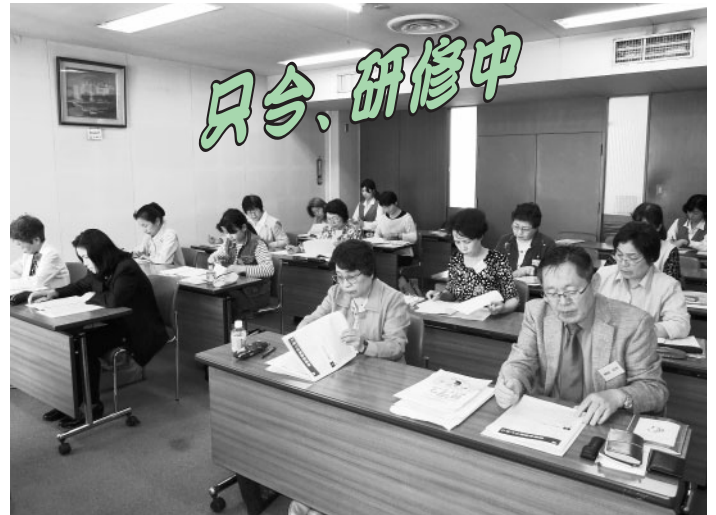
5月にはじめての生活サポーター養成研修を実施。真剣な表情で、熱心に受講する皆さん

※安心生活サポート事業とは…利用者と社協が契約を結び、生活サポーター（ボランティア経験が豊富で、養成研修を修了し、社協に登録・雇用された方）が定期訪問による状況確認、福祉サービスの利用支援、日常的な金銭管理などの援助活動を行うものです。契約後のサービスは有料です。